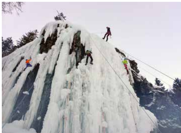
Im Eisklettergarten in Heiligenblut