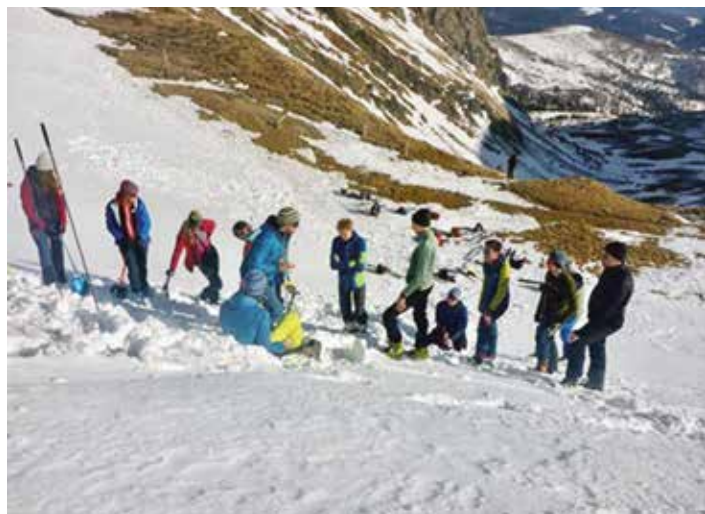
Übungen am Weg zur Falkertspitze 2.308 m