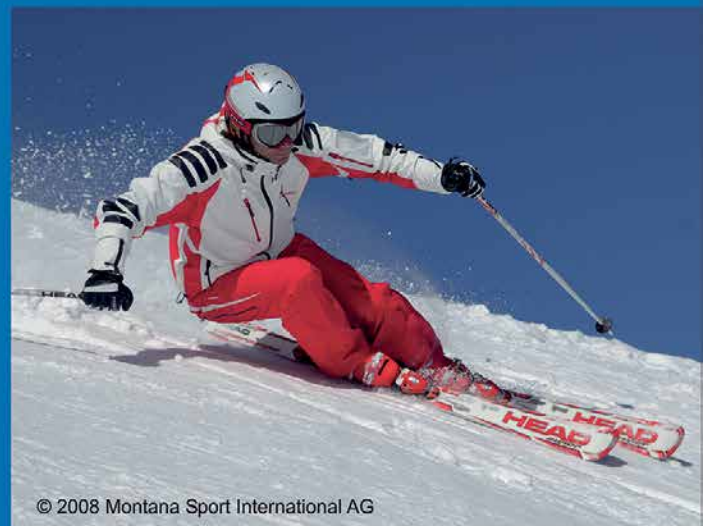
© 2008 Montana Sport International AG