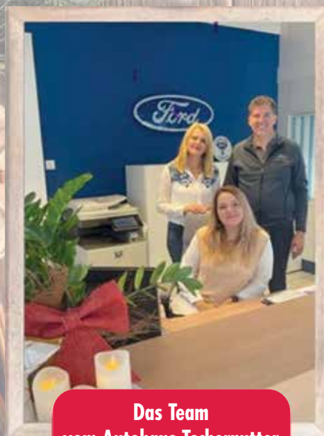
Das Team vom Autohaus Tschernutter Stationstraße 14 - 9545 Radenthein

Wir wünschen allen unseren Kunden & Freunden ein frohes Weihnachtsfest, besinnliche Feiertage und ein erfolgreiches, gesundes Jahr 2022