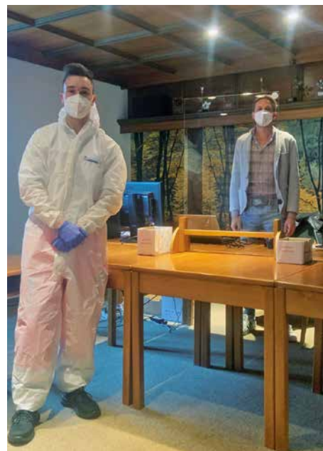
Covid-19 Testung im Gemeindeamt