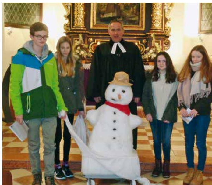
Ein besonderer Prediger beim Abendgottesdienst zum Thema „Weiß wie der Schnee“.