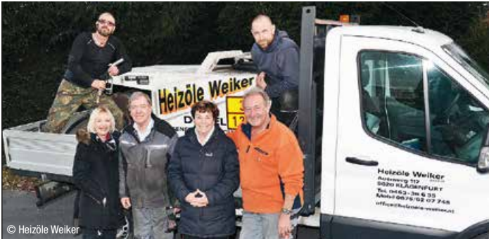
Das Team von Heizöle Weiker garantiert zuverlässige, flexible und persönliche Heizöl- und Diesel-Lieferungen bei jeder Wetterlage