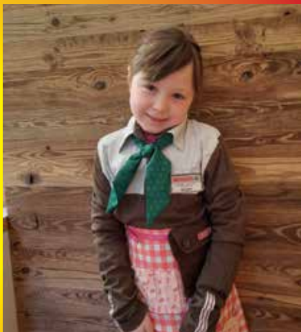
Siegerin im Einzelbewerb „Anna – die fleißige Verkäuferin“