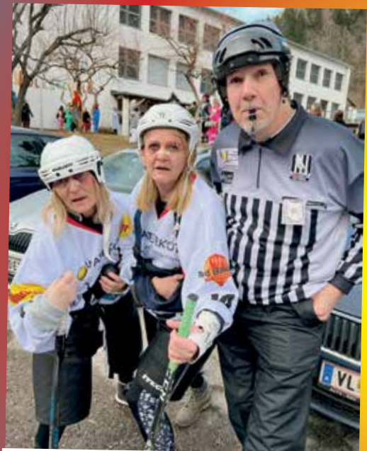
Hier regiert der ECF!