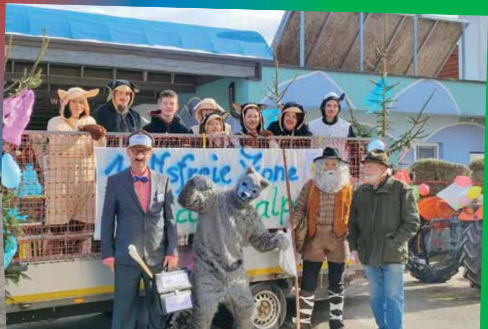
Wolfsfreie Zone Feldpannalpe