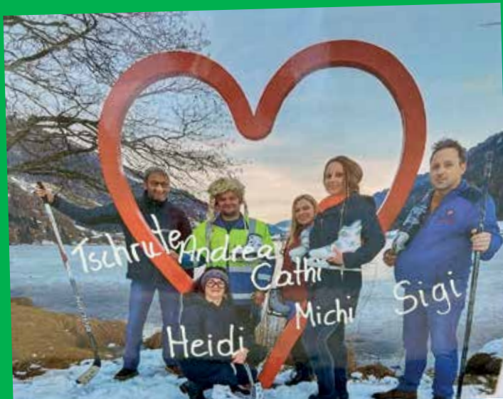
Aktuelles Pressefoto des Eislaufvereins