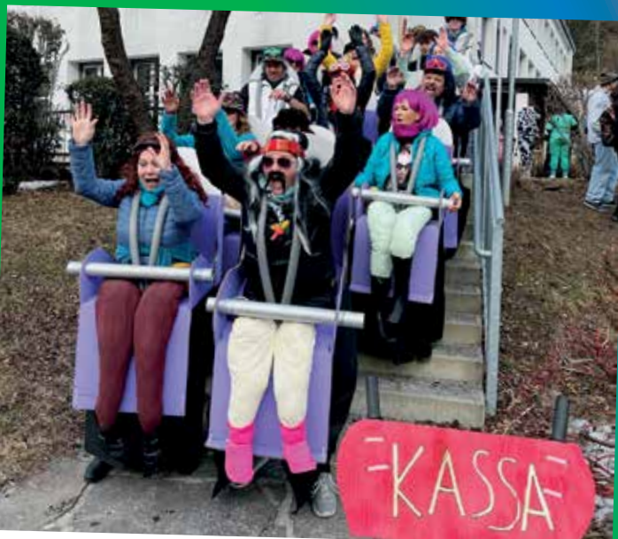
Da ging es hoch her, danke für den Besuch!