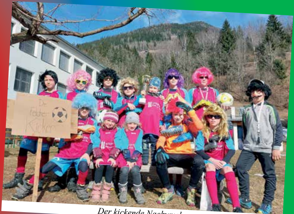
Der kicke Nachwuchs