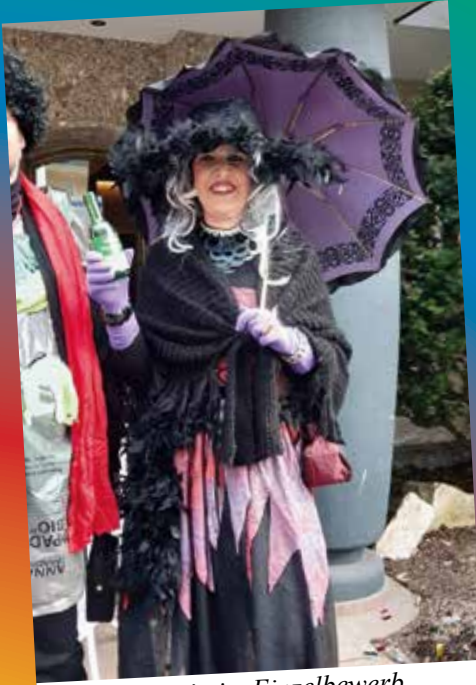
Siegerin im Einzelbewerb der Erwachsenen