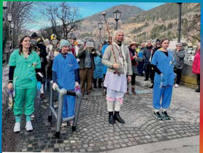
Danke der ehemaligen Trachtenkapelle! Auch in der Pension immer für unseren Ort aktiv!