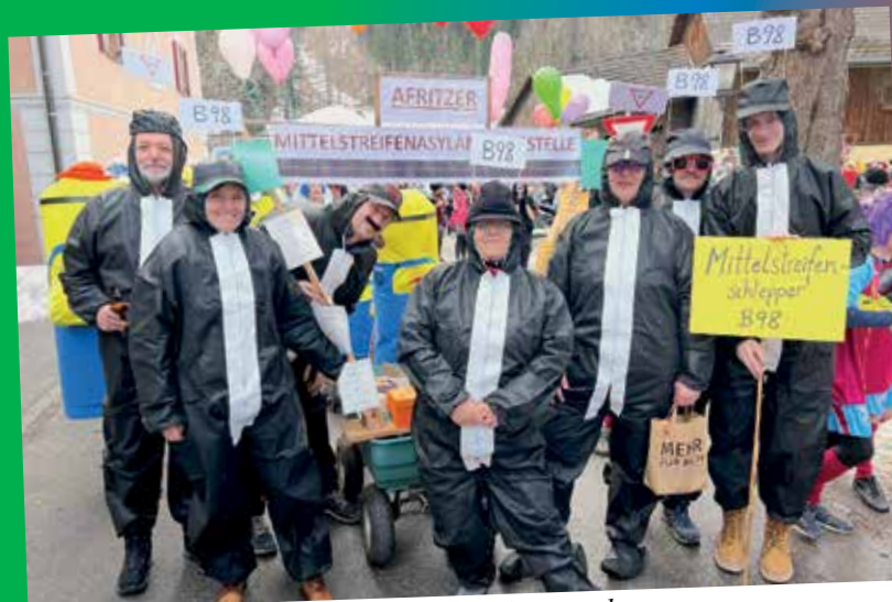
Der Afritzer Mittelstreifen wandert aus – hoffentlich nach Feld am See!