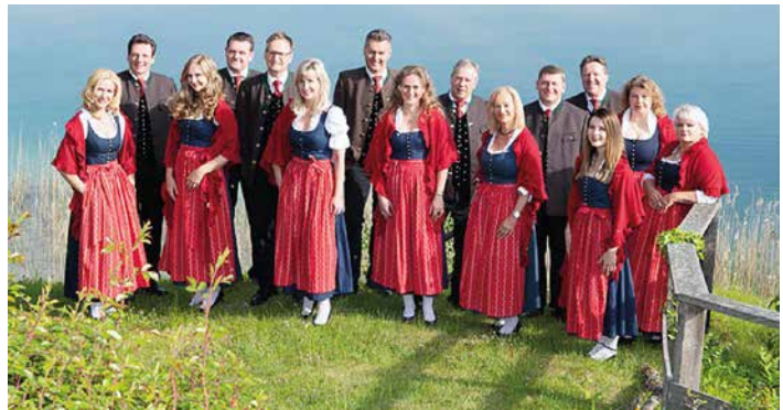
Chor „Kärntner aus Maria Wörth“