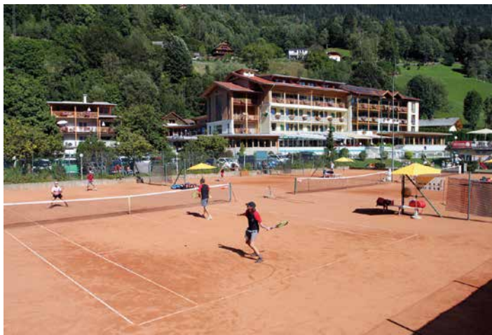
Herren Doppel Endspiel: Kranewitter/Winkler (AUT) gegen Fleischhacker/Zeiner (AUT) Sieger: Kranewitter/Winkler