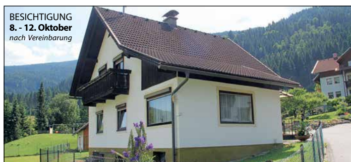
BESICHTIGUNG 8. - 12. Oktober nach Vereinbarung

Tel.: 04240 8212, info@badkleinkirchheim.at