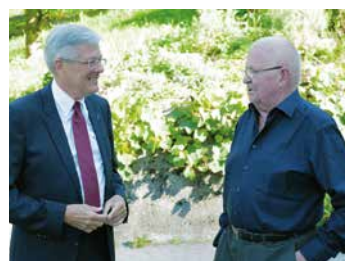
Othmar Hofer beim Smalltalk mit dem Landeshauptmann