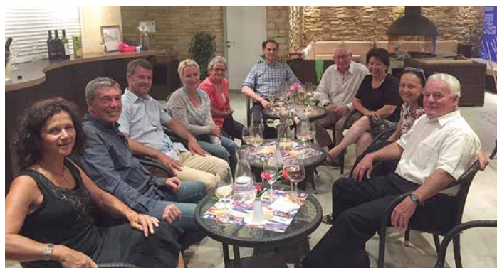
Gästeehrung im Brennseehof