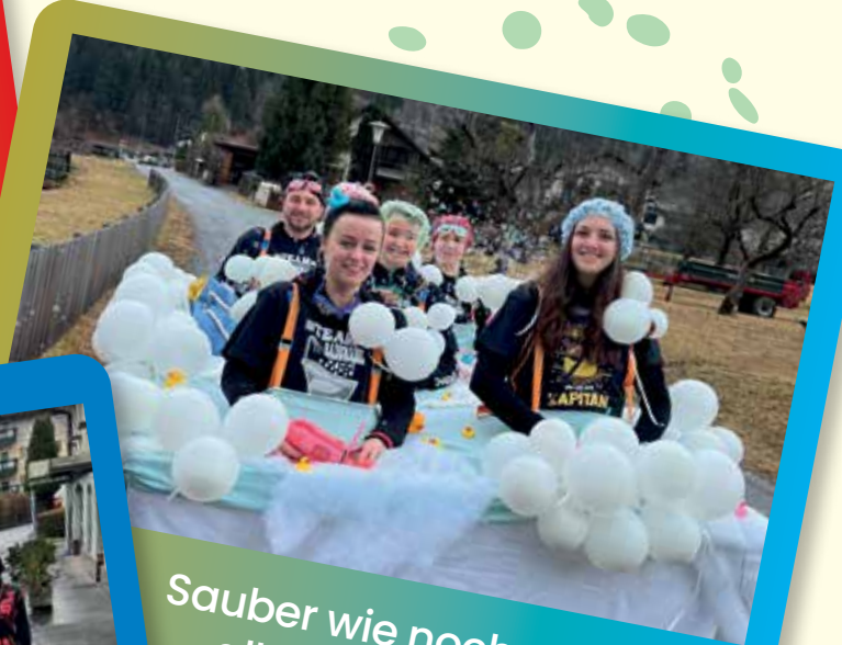
Sauber wie noch nie waren alle in der Badewanne