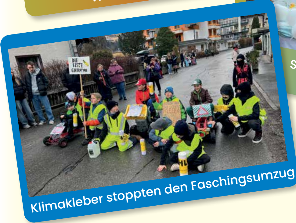
Klimakleber stoppten den Faschingsumzug