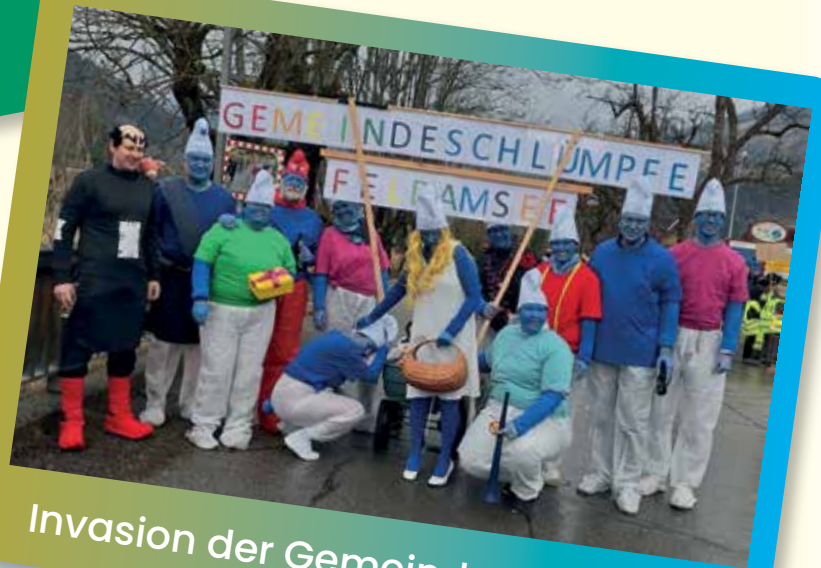
Invasion der Gemeindegelumpfe