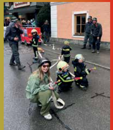
Früh übt sich...