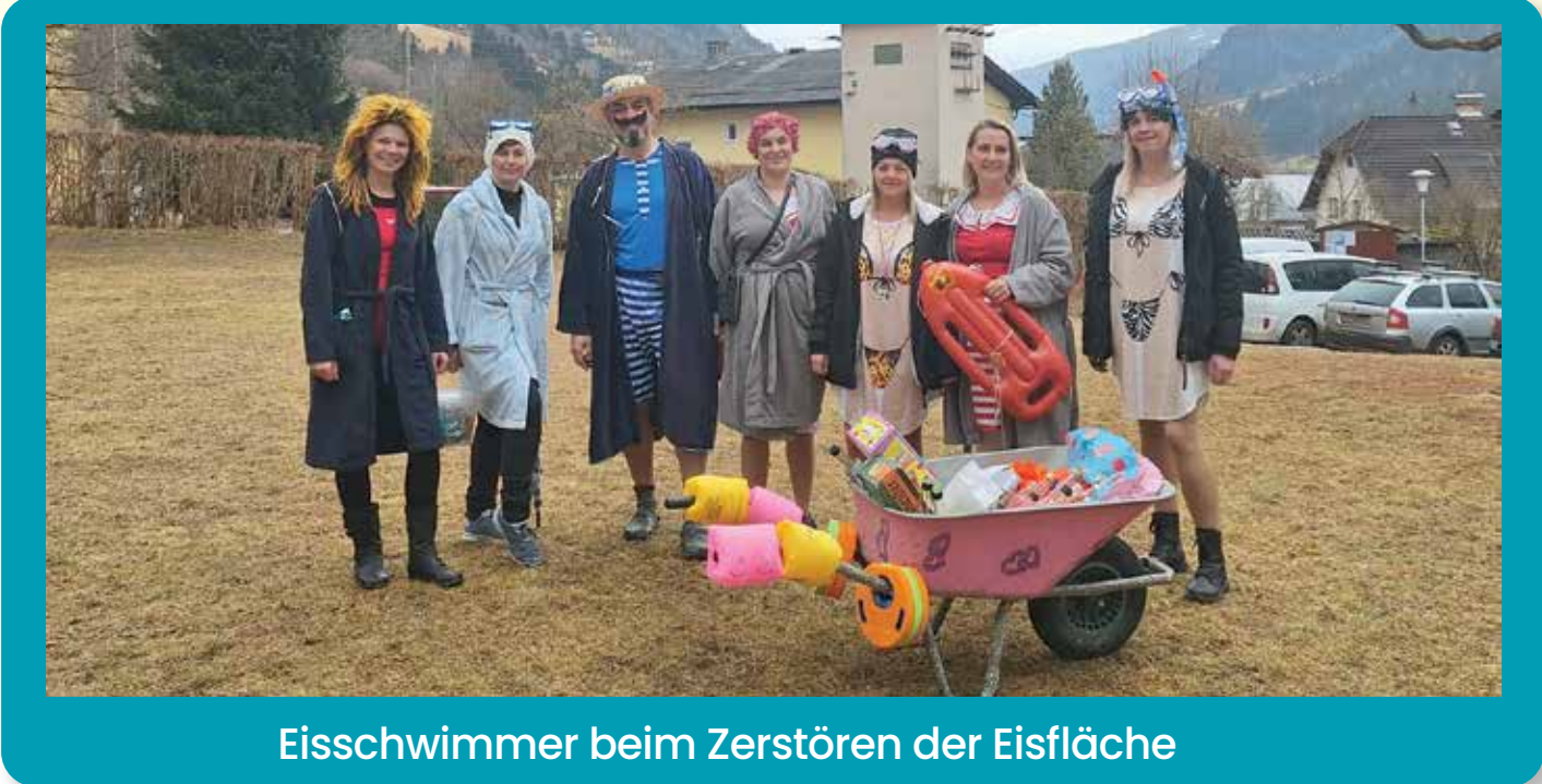
Eisschwimmer beim Zerstören der Eisfläche