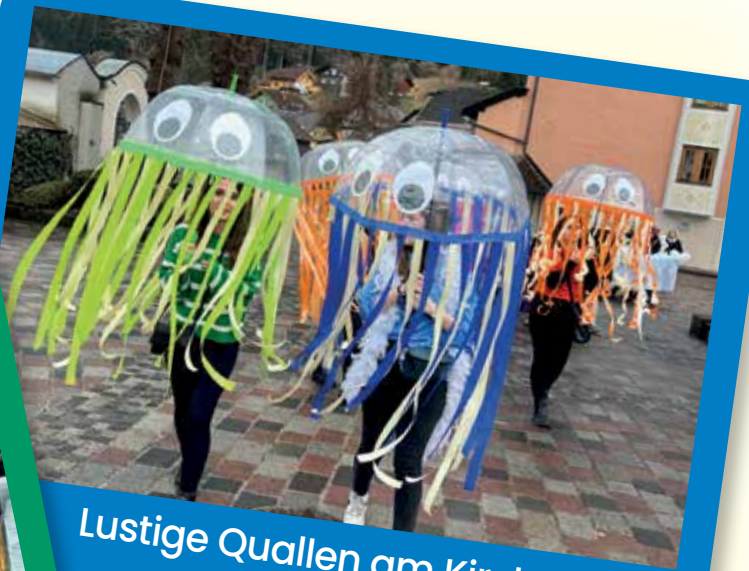
Lustige Quallen am Kirchenplatz