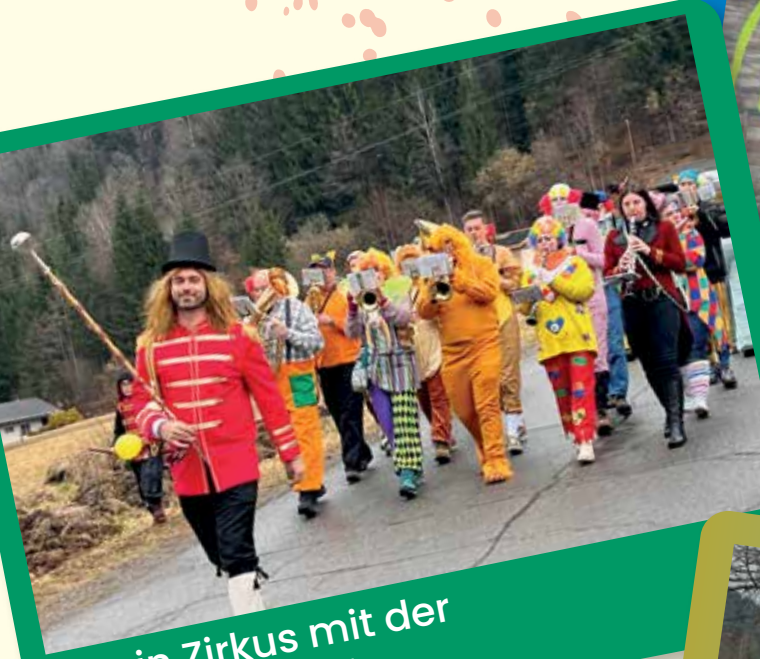
So ein Zirkus mit der Trachtenkapelle