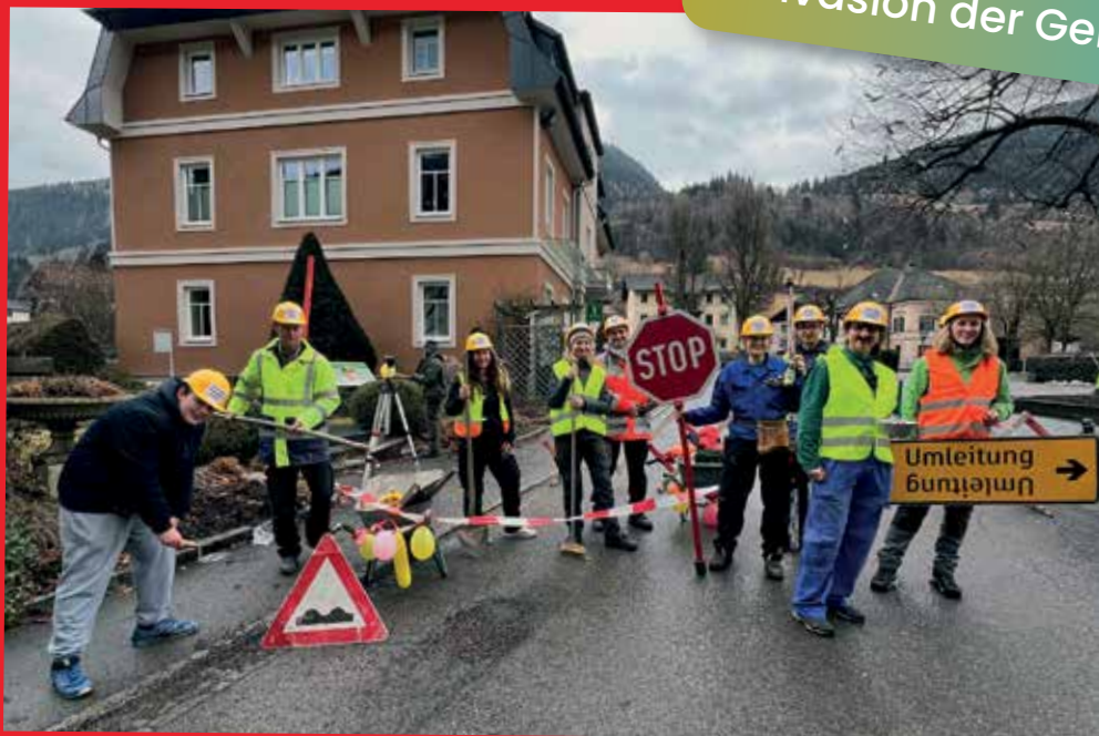
Baustellen soweit das Auge reicht