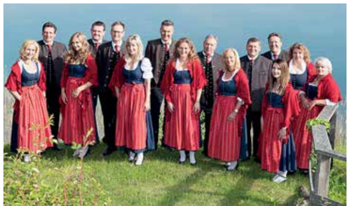
Chor „Kärntner aus Maria Wörth“