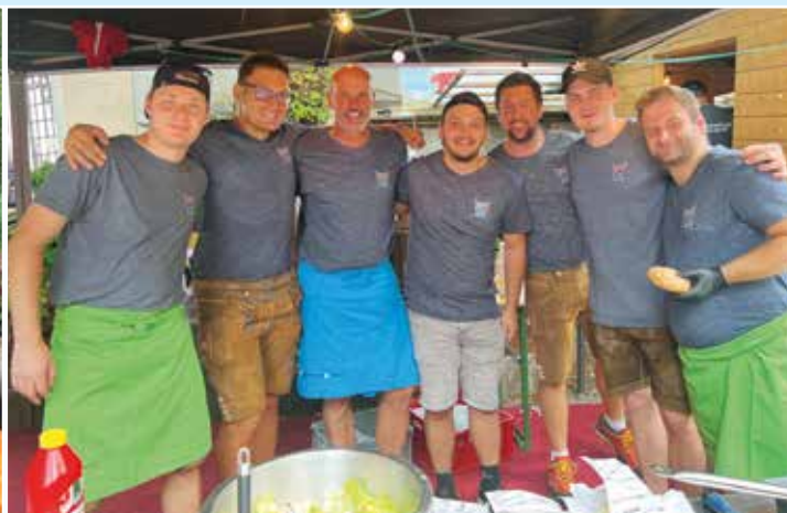
Unsere Trachtenkapelle bei der Eröffnung der Fischgenusswoche