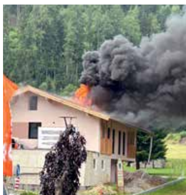
Brandeinsatz Millstätter Straße

Um die Schlagkraft der Feuerwehr zu gewährleisten und zu erhalten, sind Übungen und Schulungen zur Aus- und Weiterbildung notwendig. Im vergangenen Jahr wurden 28 Übungen mit insgesamt 1248 Übungsstunden mit unterschiedlichen Schwerpunkten organisiert, geplant und durchgeführt.